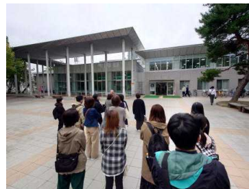
P T A 研修旅行