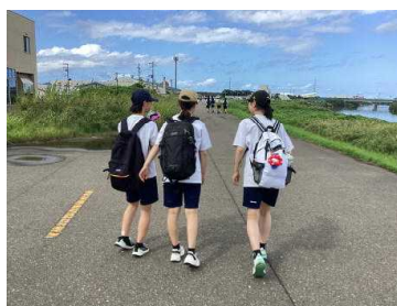
チャレンジウォーク