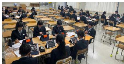
遠隔教育推進事業