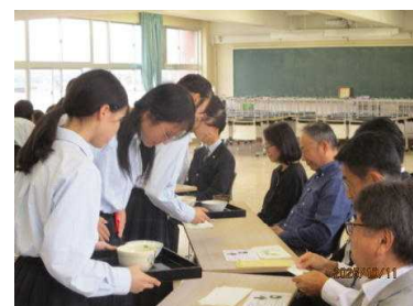
文化祭 Nao Fes !!