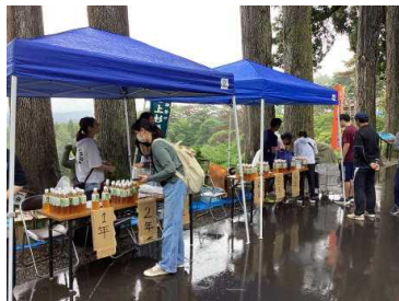
チャレンジウォークボランティア