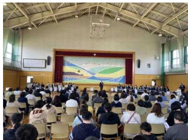
P T A 総会